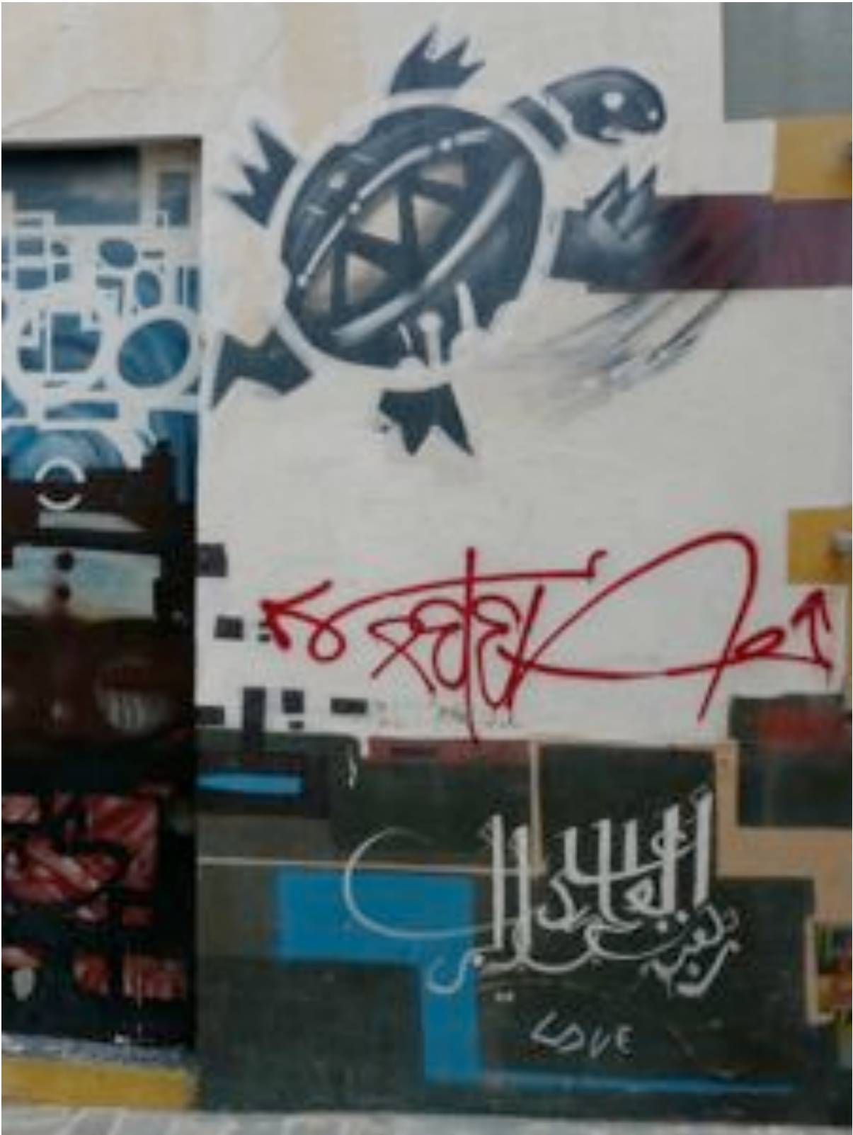
Comme cette tortue stylisée, décorée de lignes et de courbes.