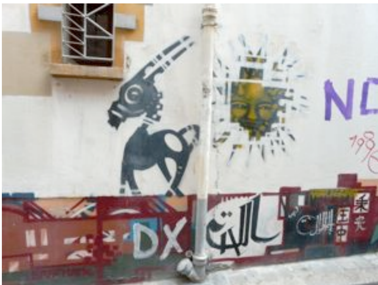
La représentation de cette antilope confirme mon sentiment.