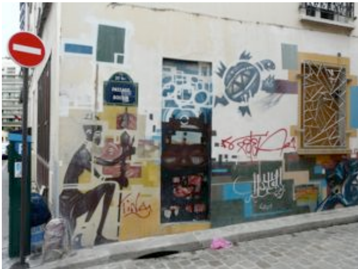
Comme ce guerrier assis patientant, sa javeline à la main, ou le masque dans l'encadrement de la porte condamnée.