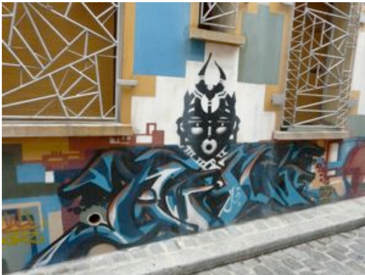
Ou cet autre masque qui est, ici, bien plus visible que le précédent.